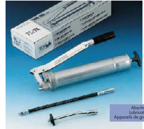
Abschmiersets Lubrication sets Appareils de graissage